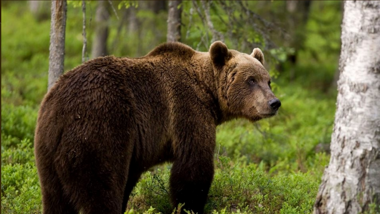
Καφέ αρκούδα (Ursus Arctos)